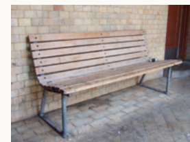
Kennismaking en oriëntatie met andere actieve deelnemers

Voor een klein bedrag per jaar voor het lidmaatschap bieden wij een informatieve website en versturen wij regelmatig nieuwsbrieven. Ook kunt u deelnemen aan de thema-avonden, kennismaken met andere leden. Er is veel kennis, ervaring en deskundigheid in onze vereniging aanwezig en we beschikken over een netwerk