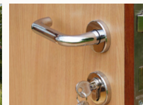
Het in stand houden, financiën, Persoonlijk toekomstplan