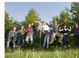
Groepsvorming, taakverdeling, vrije tijd, belangenbeartiging

Niet alleen de realisatie van een ouderinitiatief is van belang, ook het in stand houden ervan. De onderlinge samenwerking tussen de initiatieven is van groot belang voor de toekomst. Bezuinigingen en stijgende kosten maken het steeds belangrijker te leren van elkaar en goede afspraken met dienstverleners te maken. Alle kennis en ervaringen zijn ook beschikbaar voor onze leden.