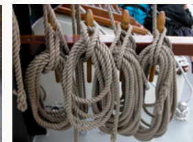
Keuzes maken nieuw initiatief Starten als deelnemer