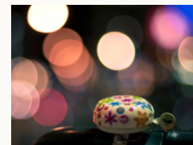
Welke mogelijkheden zijn er? Een eerste kennismaking

U bent op zoek naar een passende woonvorm voor uw zoon, dochter of familielid met een beperking. Welke mogelijkheden zijn er? Wat past het beste? Wat komt er allemaal bij kijken? Zijn er anderen met wie ik gezamenlijk kan optrekken? Welke ervaring hebben anderen die al verder zijn? Wonen, werken en welzijn; hoe kan dat worden geregeld? Wat wordt van mij verwacht als ik mij aansluit bij een ouderinitiatief?